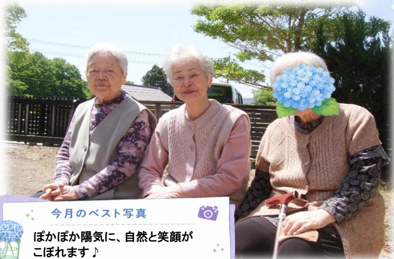
今月のベスト写真 ほかほか陽気に、自然と笑顔が こぼれます♪